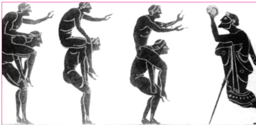
Παιγνίδι με την μπάλα στην Αττική τον 6 ο π.χ. αιώνα.

Η Ελληνική αρχαιότητα είναι γεμάτη από παραδείγματα «σφαιριστικών» παιγνιδιών τα οποία θεωρούνται σαν οι πρόγονοι των σημερινών αθλοπαιδιών. Οι νέοι της Σπάρτης αναφέρει ο Πλάτωνας 2 ήταν πάντοτε ξυπόλυτοι, με ένα λιτό ένδυμα χειμώνα καλοκαίρι, έπαιζαν παιγνίδια με μπάλα ή χόρευαν κάτω από τον ζεστό ήλιο του καλοκαιριού. Οι «σφαιρείς» ήταν οι παίκτες που έπαιζαν αυτές τις παιδιές.